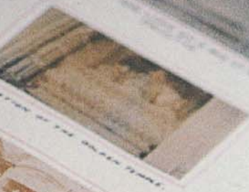
VIEW OF THE GREAT TEMPLE