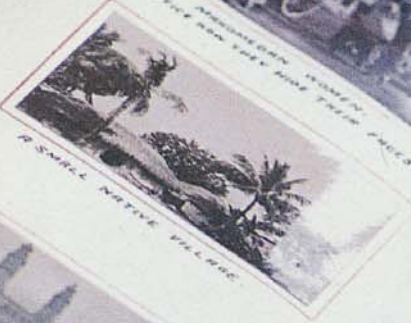
A SMALL NATIVE VILLAGE