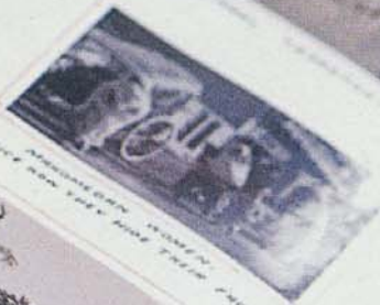
APPROXIMATELY 1880 NATIVE WOMEN WITH THEIR CHILDREN