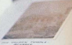
VIEW OF THE GREAT TEMPLE