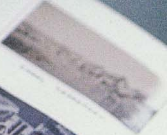
VIEW OF THE GREAT TEMPLE