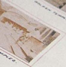
VIEW OF THE GREAT TEMPLE