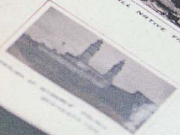
TEMPLE OF THE GREAT GODS