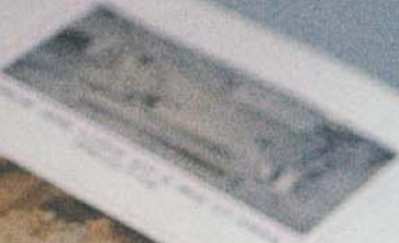
TEMPLE OF THE GREAT GODS